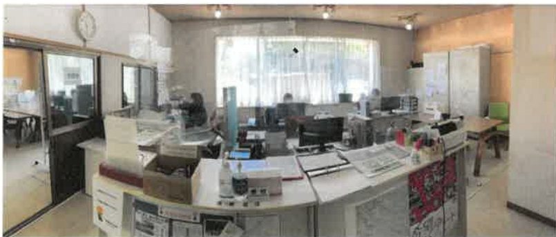
事務所 (石巻市PTA協議会さんも一緒です)