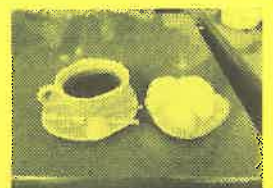
素敵なエピソードのあるコーヒー、アイスクリームと一緒に頂きました。