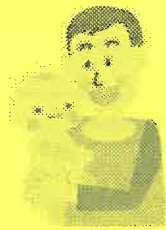
パパさんの参加も大歓迎です♪