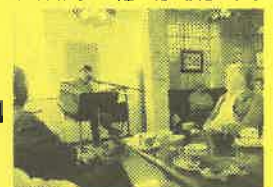
歌の合間のトークもおもしろい竹さん