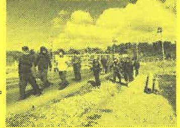
人々の暮らしがあった場所・・・