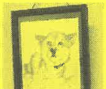
淡い色使いで、優しい 雰囲気の作品達