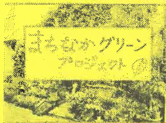
川・水・緑・空と自然が調和する街