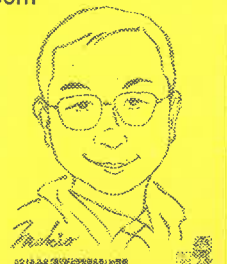
↑ 似顔絵書きの方に 代表の顔を書いて いただきました

当日は暴風のため急きょエスタ様のご協力を得て、 市役所1階をお借りすることができました。 いしびよんも応援に駆けつけてくれ、お汁粉や暖かい 飲み物の提供など市民団体さんのお手伝いもあり 当日ボックスに投函された手紙は192通、Webでの メッセージは44通もいただくことができました。 ご協力ありがとうございました。