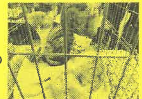
同時に、犬と猫の 里親探しも開催 されていました。