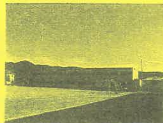
校庭に建設された仮設校舎

以前、イベントの際に支援物資として使い切りカメラをたくさん頂きました。ぜひ学校でご活用して頂ければと思い、お声掛けし、ご希望のあった学校へお届けに行きました。震災により大きな被害を受け、校舎が使えなくなってしまった為、他校の校舎内へ移転されている学校が多いです。校庭に仮設校舎が建設されている光景も多く見られ、改めて被害の大きさを感じました。各学校の先生方、カメラを喜んで受け取って下さいました。どうぞご活用下さい。