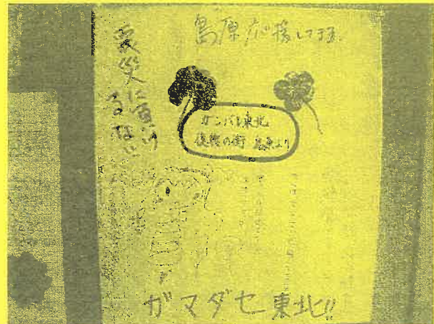
全国の皆様、温かい支援ありがとうございます。