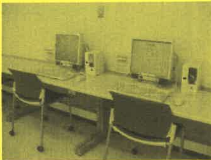
市民サロンでは インターネットパソコン(30分100円)や 軽食も可能ということです。