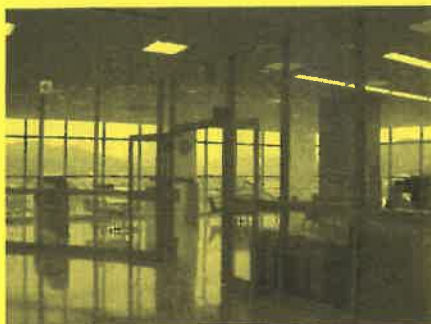
市民サロンは見晴らしのいい 憩いの場として、 夜間や休日も利用できるということです。