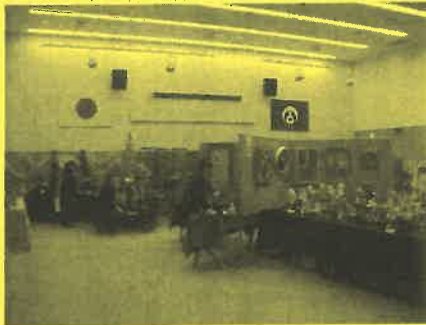
創作人形やスタンドグラス、押し花 ちぎり絵などなどたくさんの展示