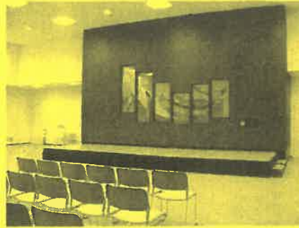
市民ホールにはステージもあり、 土・日は舞台公演を予定しています。