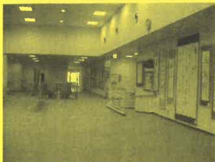
かつて映画館のロビー部分を 市民ホール・ギャラリーへ改装

4月4日(日)～12日(月) 10:00～17:00 石巻市役所 新庁舎 6階 石巻市と石巻市文化協会主催の展示会と発表会が開催されています。