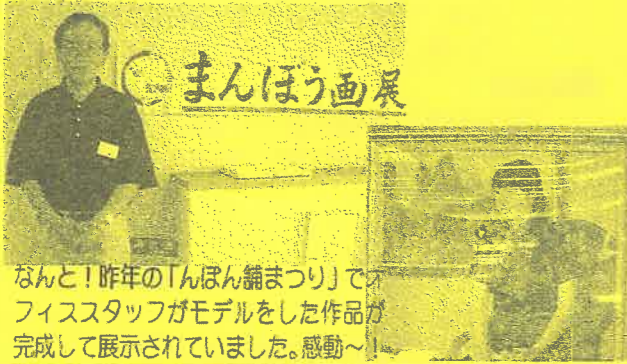
なんと！昨年の「んぽん舗まつり」でオフィスタッフがモデルをした作品が完成して展示されていました。感動～！

取材で伺いましたが、展示してある絵を見て私も「やさぎの時間」を味わえました。 by U