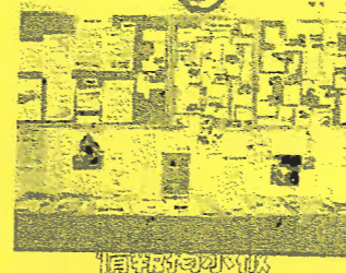
石巻市NPO支援オフィス