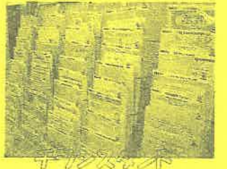
情報提供サービス

石巻市NPO支援オフィスでは、市民公益活動情報を いろんな形で、いろんな所に発信しています。