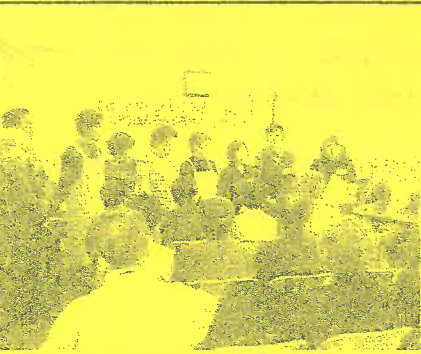
デイサービス・スタッフの皆さん