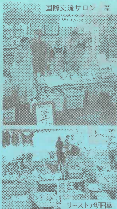
国際交流サロン 葺