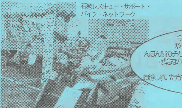
石巻レスキュー・サポート・バイク・ネットワーク