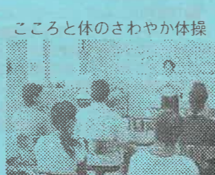
こころと体のさわやか体操