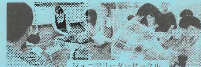
ジュニアリーダーサークル げろっば

健常者と障害者の境界線は、私たちが生活している現在の環境を基準として、作り上げられたものであり、永続的・断片的な境界ではないのかもしれないと感じました。私達は、メガネをかけている人が障害者ではないと判断しますが、近い将来、車椅子がメガネのように誰もが利用し、デザインすら選べるようになっていこう!車椅子を必要とされる方々も、もはや特別的存在でも障害者でもなくなるかもしれません。健常者と障害者はお互いにかけ離れた存在ではないのかもしれないね。☺