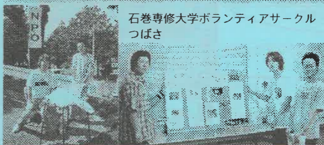
石巻専修大学ボランティアサークル つばさ