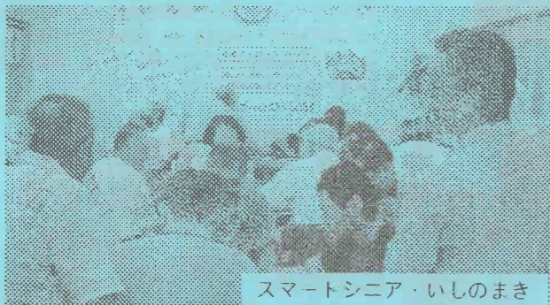
スマートシニア・いしのまき