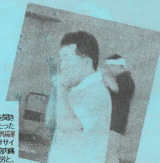
特定非営利活動法人 みやぎボクシングクラブ

今野先生が「脳の活性化について」ユーモラスに語ってくださるのを聞きながらストレート・ジャブ・フック・ブロックの基本を学びました。「たった二分のシャドーボクシングを繰り返すだけ」と軽く見ていた私も真高運動の醍醐味です。その後テンポよく行われたボクササイズは効率的な全身運動。それは翌日、ありとあらゆる箇所で見られた筋肉痛が証明してくれました。1時間のコースを終えるころは心地よい疲労と、「私って成長っちゃった!」という達成感を味わえるボクササイズ、おめでとう! ☺