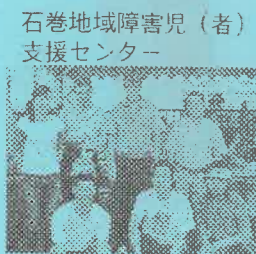
石巻地域障害児(者)支援センター