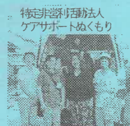
特定非営利活動法人 ケアサポートぬくもり