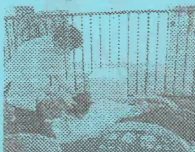
英国武リフレクソロジー研究所「びゅあ」